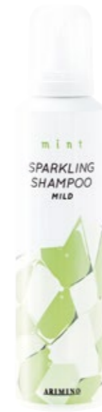
ミント スパークリングシャンプー マイルド