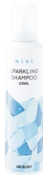
ミント スパークリングシャンプー クール