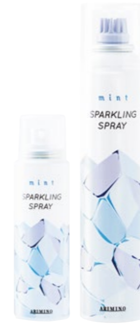
ミント スパークリングスプレー ＜頭皮用トリートメント＞