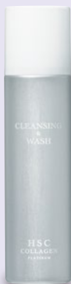
塗るサプリ クレンジング&洗顔 (180g) 4,500円(税抜)