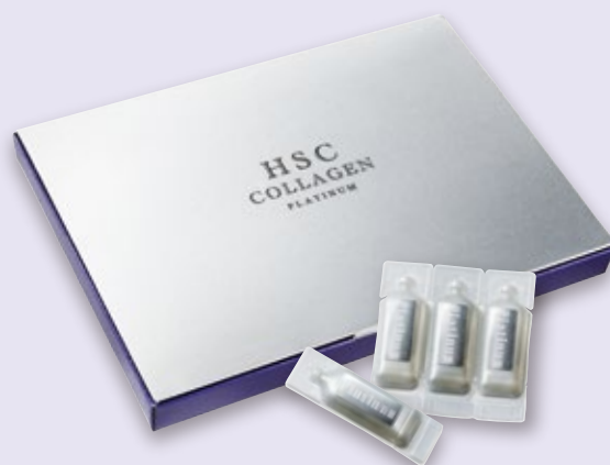
塗るサプリ HSCコラーゲンプラチナム (5mL×18本) 12,000円(税抜)