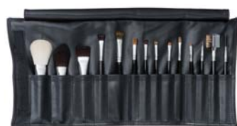
ブラシフルセット