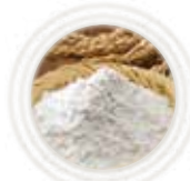
コメ粉 粒子が細かく 弾力があるのが特性

網目構造により染料が自由に動きづらく、染色及び自然な退色の妨げに。網目構造を弱くしてしまうと、毛髪にクリームが留まりにくくなってしまいます。