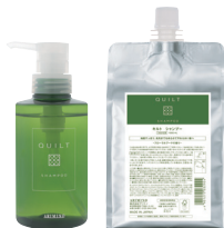
キルト シャンプー 270mL ¥1,500(税込 ¥1,650) /1000mL

※1 環境に配慮した成分や容器、製造方法を採用 ※2 植物エキスなど非加熱で製造