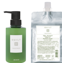
キルト トリートメント 270g ¥1,500(税込 ¥1,650) /1000g

※上記アイテム(1000mL/1000g)対応の「アミノ共通詰め替え用ボトル」は別売りです。