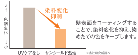
〈ヘアカラーの色調変化〉

サンシールド AL 施術 開いたキューティクル間にオイルクリームが馴染み、吸着してコーティングします。