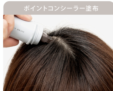
ポイントコンシーラー塗布