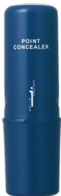
カラーストーリーiプライム ポイントコンシーラー 毛髪着色料(全3色) 10mL 1,800円(税抜)

“グレイカラーをしても、2～3週間すると根元が気になる…” “サロンに行く時間がなくて、ついホームカラーをしてしまう” そんなお客様へ。生え際・分け目の気になる白髪をコーミングするだけで1日カバー。 サロンカラーとの併用セルフケアで、365日のグレイカラービューティをご提案します。